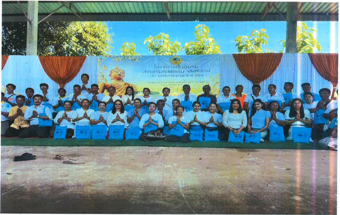
ประมวลภาพกิจกรรมโครงการฝึกอบรมส่งเสริมคุณธรรม จริยธรรม ประจำปีงบประมาณ พ.ศ. ๒๕๖๖ ณ สำนักงานเทศบาลตำบลลาดแร้ง อำเภอบ้านเขว้า จังหวัดชัยภูมิ